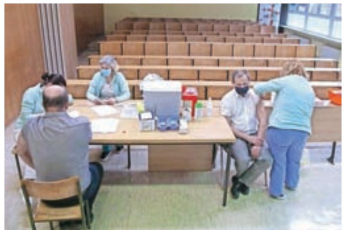
Cepljenje zaposlenih na Osnovni šoli Železniki / Foto: Gorazd Kavčič