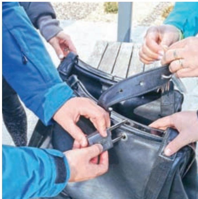
Pobeg iz mesta Železniki

Res si želimo, da bi se stanje z okužbami izboljšalo, saj komaj čakamo na ponovno odprtje poleg zgoraj omenjenega tudi terase bifeja bazena. Nikakor si oktobra, ko smo morali zapreti, nismo mislili, da bo zaprtje trajalo toliko časa. Prav pogrešamo stik z vami in druženje na terasi ob dobri kavi, vroči čokoladi in sproščenem kramljanju o vsakodnevnih prijetnih in manj prijetnih skrbah, ki jih prinaša življenje.