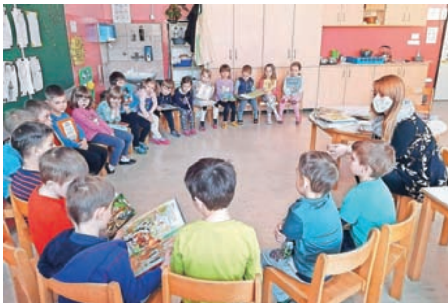
Takole so otroci predstavili svoje knjige.