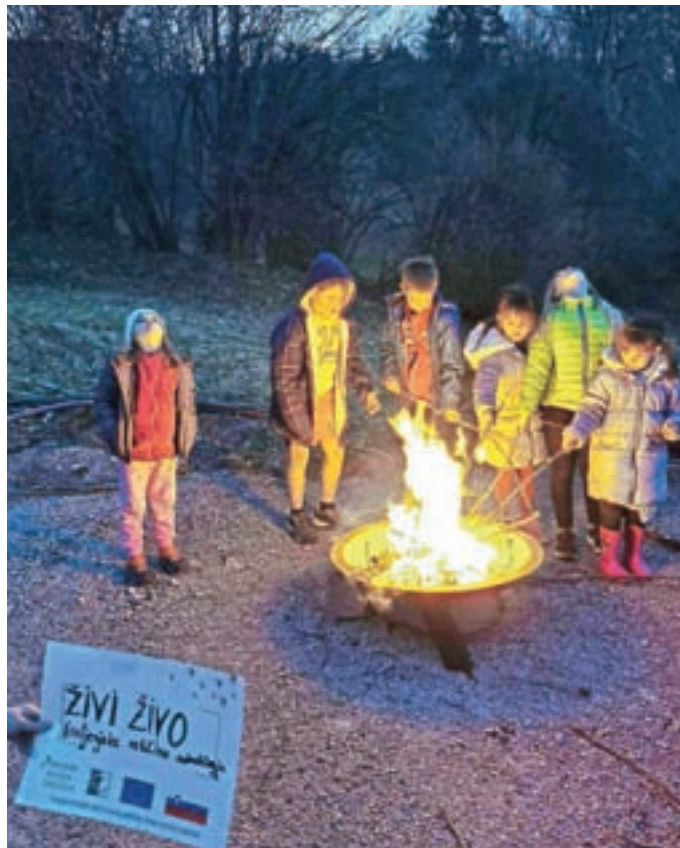
Utrinek z delavnice Pravljično ognjišče

Izvajamo tudi delavnice za otroke in mladino, in sicer Pravljično ognjišče s pripovedovanjem pravljic ob ognjišču, rokodelstvom, preprostimi praktičnimi znanji, spoznavamo različne pedagoške teme, npr. o pomenu proste igre, zakaj je dolčas pomemben itd. Delavnice izvajamo tudi za mladino. Digitalna kompetenca je digitalna abstinenca (poklicna orientacija, rokodelstvo, opazovanje sveta, razvoj idej ...). Za izvedbo smo že v dogovoru z Javnim zavodom Ratitovec.