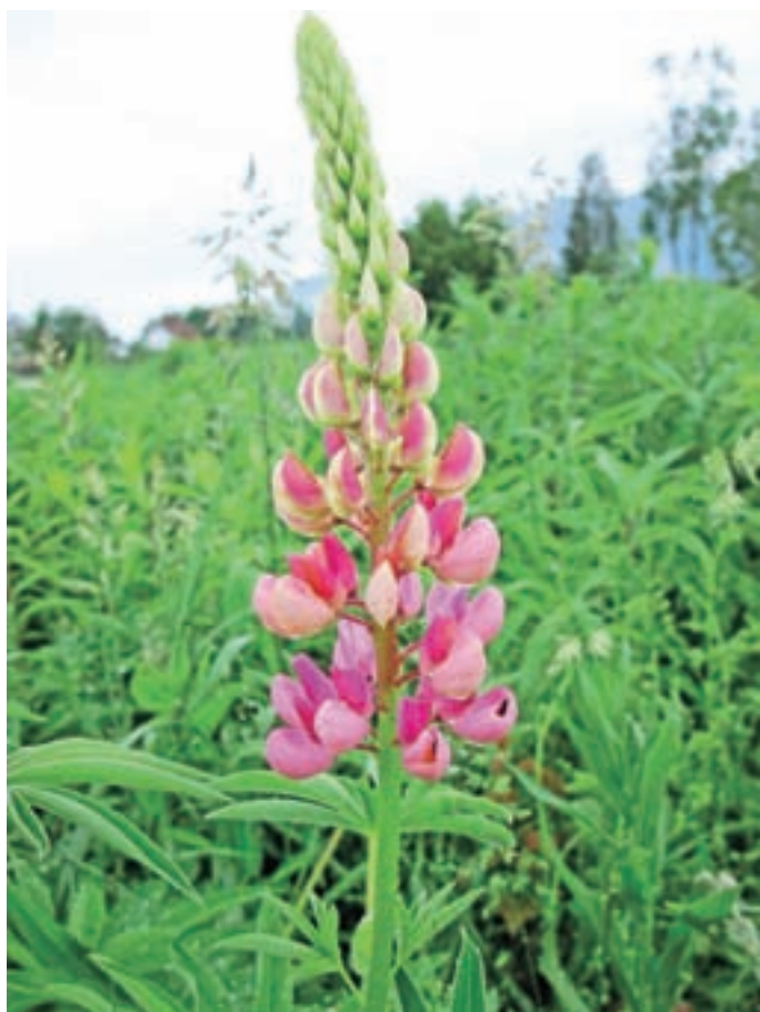
Mnogolistni volčji bob se lahko zelo razraste po travnikih.