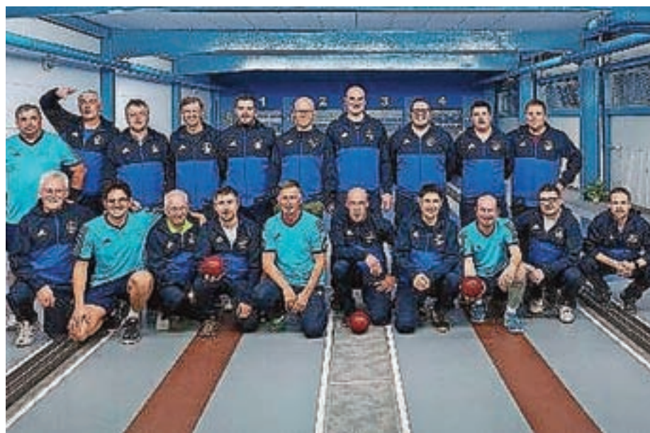
Kegljaški klub Železniki

V letu 2020 nismo podelili zlate plakete za športnico občine Železniki, priznanja za perspektivnega mladega športnika občine Železniki in priznanja za posebne dosežke na področju rekreacije v občini Železniki, saj za omenjena priznanja nismo prejeli predlogov.