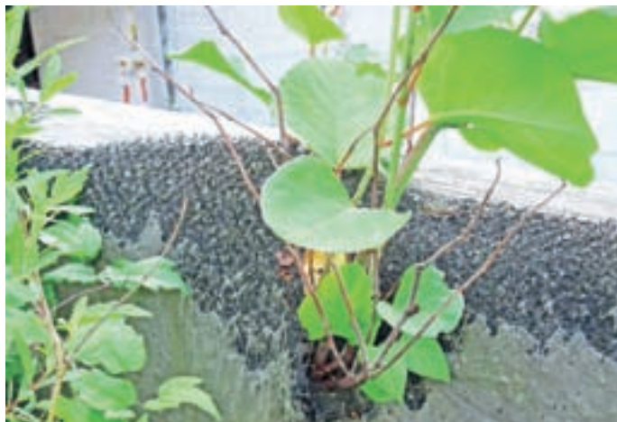
Japonski dresnik lahko povzroča škodo v gradbeništvu.

Negativni vplivi invazivnih tujerodnih vrst so vedno večji in vedno opaznejši. Zaradi trgovine in hitrega transporta je njihov vnos, pa naj bo nameren ali nenameren, vedno večji. Zaradi škodljivih vplivov je Evropski parlament leta 2014 sprejel Uredbo o preprečevanju in obvladovanju vnosa in širjenja