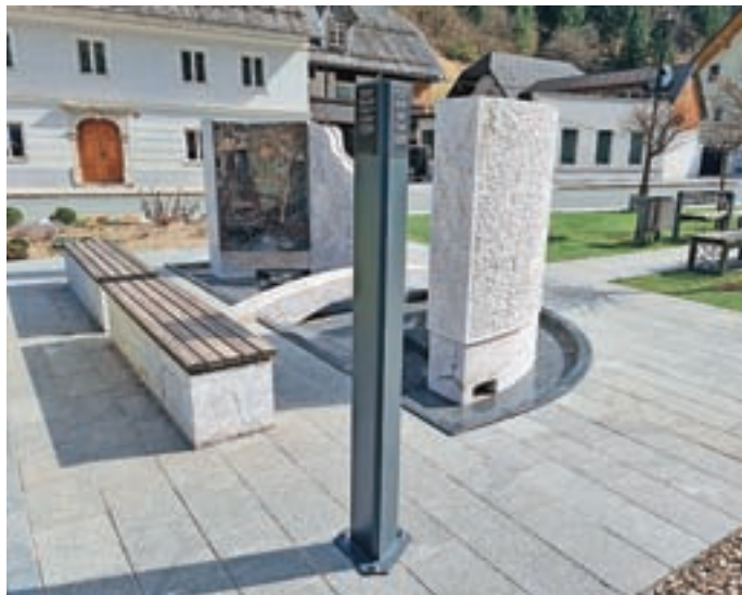
Stebriček pri vodnjaku na "placu" pred cerkvijo v Železnikih

Ob spomeniku oz. vodnjaku na "placu" pred cerkvijo obiskovalec med drugim izve, da monolitna usločena bloka predstavljata vpetost Selške doline med hribe in gore ter njeno povezanost s Selško Soro. Kamniti blok med njima premošča vodo in predstavlja povezavo med krajanima ter odprtost v svet. Tekoča voda, ki pomeni življenje, je obenem prisposoda napredka in tudi spoštovanja do moči narave. Bronasta reliefa pripovedujeta zgodovino kraja. Spomenik je bil postavljen leta 2013 v neposredni bližini, kjer je stal javni vodnjak na