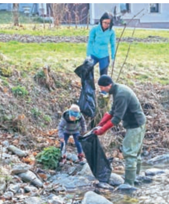
Čiščenje brežin vodotokov