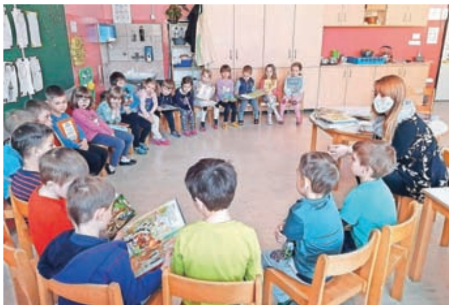
Takole so otroci predstavili svoje knjige.