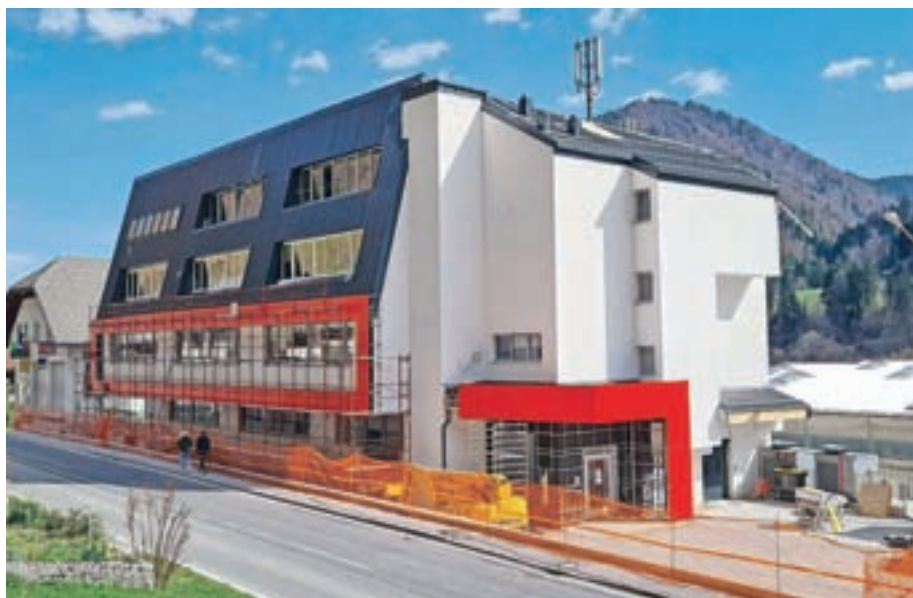
Sanacija poslovne stavbe na Češnjici vključno z ureditvijo okolice bo končana predvidoma v drugi polovici aprila.

"Ponosen sem na sodelavke in sodelavce, njihov vsakdanji trud in prizadevanja za razvoj podjetja, brez česar mi nikoli ne bi uspelo zgraditi mednarodno