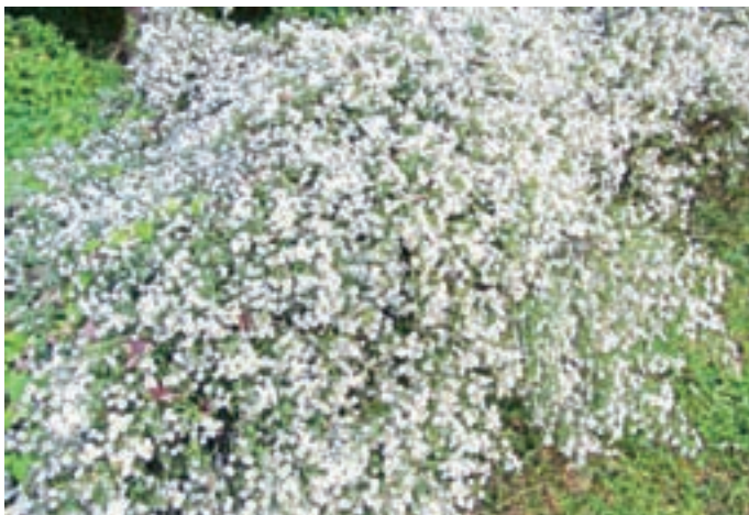
Tudi severnoameriške nebine rade pobegnejo v naravo.

Vseh invazivnih tujerodnih vrst pa na nova območja nismo pripeljali kot zaželene vrste, ampak so se nehote pripeljale s tovorom. Tako se je v Evropo že po prvi svetovni vojni pritihtapil na primer koloradski hrošč.