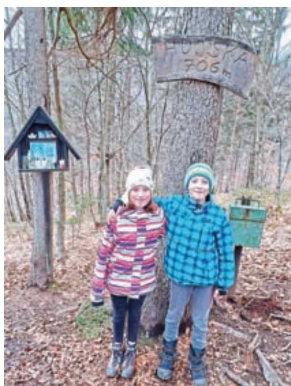
Orientacija po okoliških vrhovih

vijo štiri izzive in tako dobijo možnost pomilostitve. Izzivi so bili kuharske, športne, ustvarjalne in duhovne narave. Dan pred sodnim dnevom so dokaze o izpolnitvi izzivov poslali sodnikom (beri voditeljem), ki so jih nato na nedeljo povabili na srečanje na Zoomu, kjer so skupaj preverili dokaze in obtožencem dali še zadnje možnosti zagovora. Sodniki so presodili, da so si vsi prislužili svobodo. Ponovno pa smo sodelovali tudi v dobrodelni skavtski akciji Luč miru iz Betlehema. Ta je nosila sporočilo Prižgimo bližino!, saj menimo, da sta v teh časih ljubezen in bližina ključnega pomena, vsako dobro in ljubeznivo dejanje pa pomaga vlivati upanje tistim, ki ga najbolj potrebujejo. Plamen, ki je do nas pripotoval iz Betlehema, smo podelili po naši in sosednjih župnijah, s sredstvi, prejetimi v obliki dobrodelnih prispevkov, pa smo podprli dve organizaciji. Prva je slovenska neprofitna organizacija Lunina vila, katere poslanstvo je zdravljenje in pre-