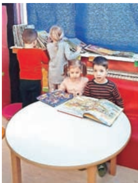
Pripravili smo svoj bralni kotichek.