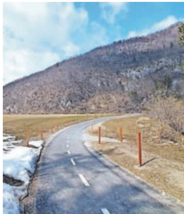
Kolesarska pot v občini Bohinj

Ta dokument je ključen za pripravo občinskega prostorskega načrta, če želimo npr. vključiti nove prostore za kampinganje in kolesarsko stezo v prostor. In kakšen je moj pogled na kolesarsko stezo? Umeščena mora biti v prostor izven naselij, ob reki Sori, na lokaciji od Škofje Loke do Petrovega Brda. Voditi mora mimo gostinskih objektov (Dolenja vas, Luša), mimo športnega parka (Rovn) po