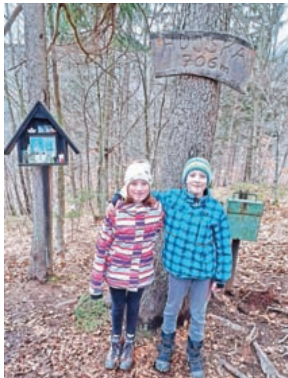
Orientacija po okoliških vrhovih

vijo štiri izzive in tako dobijo možnost pomilostitve. Izzivi so bili kuharske, športne, ustvarjalne in duhovne narave. Dan pred sodnim dnevom so dokaze o izpolnitvi izzivov poslali sodnikom (beri voditeljem), ki so jih nato na nedeljo povabili na srečanje na Zoomu, kjer so skupaj preverili dokaze in obtožencem dali še zadnje možnosti zagovora. Sodniki so presodili, da so si vsi prislužili svobodo. Ponovno pa smo sodelovali tudi v dobrodelni skavtski akciji Luč miru iz Betlehema. Ta je nosila sporočilo Prižgimo bližino!, saj menimo, da sta v teh časih ljubezen in bližina ključnega pomena, vsako dobro in ljubeznivo dejanje pa pomaga vlivati upanje tistim, ki ga najbolj potrebujejo. Plamen, ki je do nas pripotoval iz Betlehema, smo podelili po naši in sosednjih župnijah, s sredstvi, prejetimi v obliki dobrodelnih prispevkov, pa smo podprli dve organizaciji. Prva je slovenska neprofitna organizacija Lunina vila, katere poslanstvo je zdravljenje in pre-