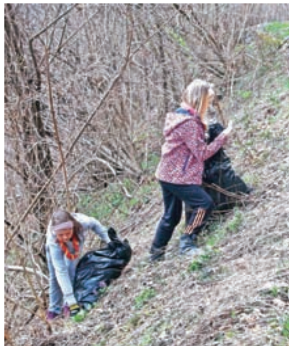
V Železnikih so se akciji pridružili tudi taborniki.

šestdeset, od tega veliko otrok. Čistilna akcija je po besedah Jelenčeve povežala celo vas oz. združila KS ter športno, gasilsko in kulturno-turistično društvo. Ženske in otroci so po vasi pobirali odpadke, moški pa so pometli ceste in odstranili pesek, ki je ostal od zimske