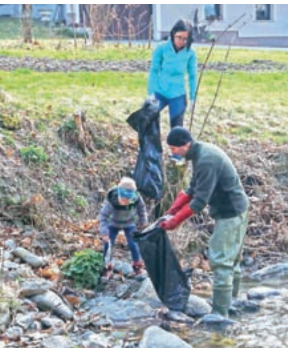
Čiščenje brežin vodotokov