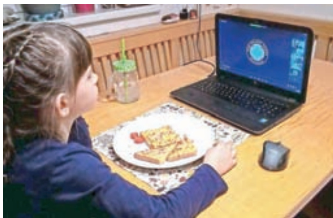
Namesto tradicionalnega zimovanja smo pripravili ZOOMovanje.

Kljub temu pa taborniki nismo stali križem rok – maškare so zimo že pregnale, zato smo tradicionalno zimovanje preimenovali v (upamo, da ostane netradicionalno) ZOOMovanje. Čeprav smo spali doma, smo si vzdušje taborjenja pričarali tako,